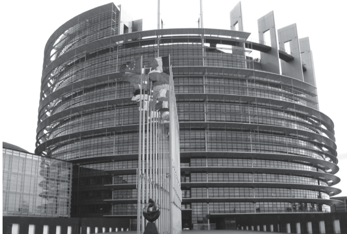
مقر البرلمان الأوروبي

مراجعة بنود الاتفاقية المبرمة مع الاتحاد الأوروبي. أمام المنتجين الأوروبيين. مبرزا الأهمية التي تمثلها الأسواق الأوروبية بالنسبة للخضراوات والفواكه المغربية، بالنظر إلى عامل القرب، لفت بعين المنتجين، إلى أن الامتيازات التي يحصل عليها المنتجون الأوروبيون والخضراوات والفواكه المغربية ليست مجانية، بقدر ما يتعلق الأمر بتنازلات متبادلة ومتفق عليها بين الطرفين المغربي والأوروبي، يوضح بعين المنتجين، في إشارة إلى التنازلات التي قدمها المغرب للأوروبيين في مجال المواد الفلاحية المحولة وكذلك فيما يتعلق باستيراد الحبوب والقطاني. كما بعين المنتجين، فيما يبقى من حقه أحادي الجانب، فيما يبقى من حقه المغرب، اتخاذ كافة الإجراءات المناسبة